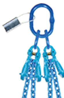
Charges maximales d'utilisation (CMU ou SWL) en Tonnes